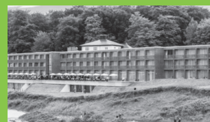
Hotel Marselis, Århus www.helnan.dk/marselis