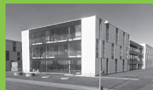
Innovatorium, Herning www.innovatorium.info