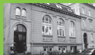
La Oficina, Frederiksberg www.laoficina.dk